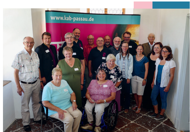
Die neu gewählte DL

HANDELN: menschenwürdig statt prekär arbei-ten; u. a. einen Sinn im Tun sehen können, eine gute Arbeit verrichten dürfen, sozial abgesichert sein, das eigene Leben planen können, eine Per-spektive haben, Kooperation statt Konfrontation, Menschen beteiligen und in den Mittelpunkt stellen.