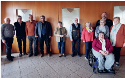
Mitglieder der Diözesanleitung bei der Klausur in Tiefenbach